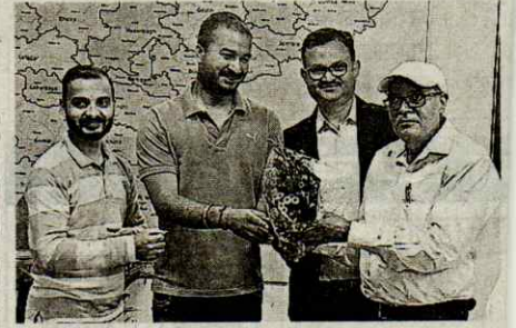
निदेशक प्रमुख का स्वागत करते कर्मचारी संघ के सदस्य